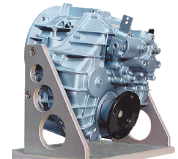
ZF 63 A