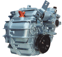
ZF 25 A