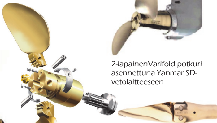
2-lapainen Varifold potkuri asennettuna Yanmar SD-vetolaitteeseen