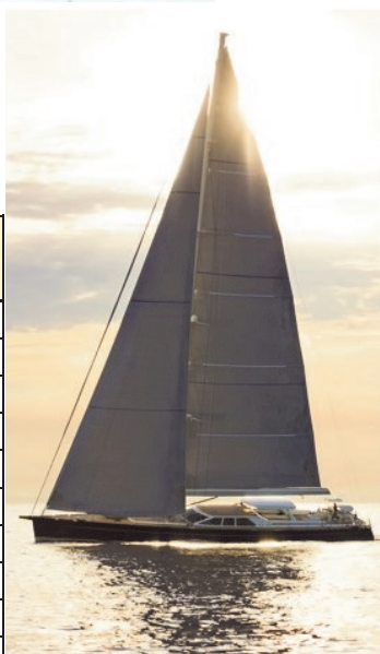
Baltic 112 ja Varifold 4-lap. potkuri